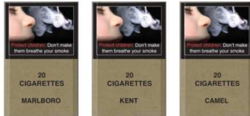
Primer univerzalnih škatlic v Kanadi

Več si lahko preberete na: http://www.ensp.org/node/1115